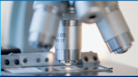
54 Forschungsprojekte umfasst das Deutsche Mobilfunk Forschungsprogramm